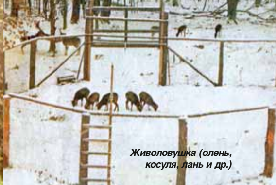
Живолушка (олень, косуля, лань и др.)