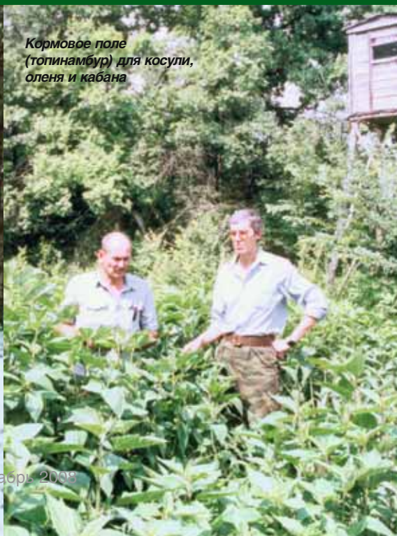
Кормовое поле (топинамбур) для косули, оленя и кабана