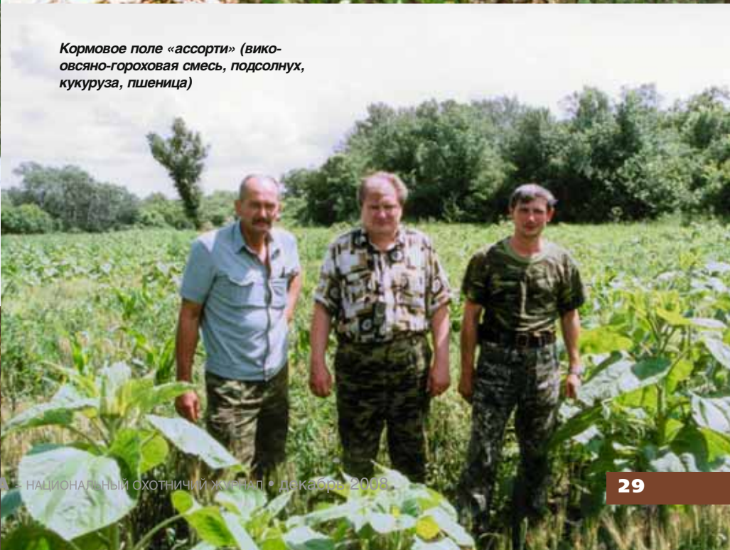
Кормовое поле «ассорти» (виковосяно-гороховая смесь, подсолнух, кукуруза, пшеница)