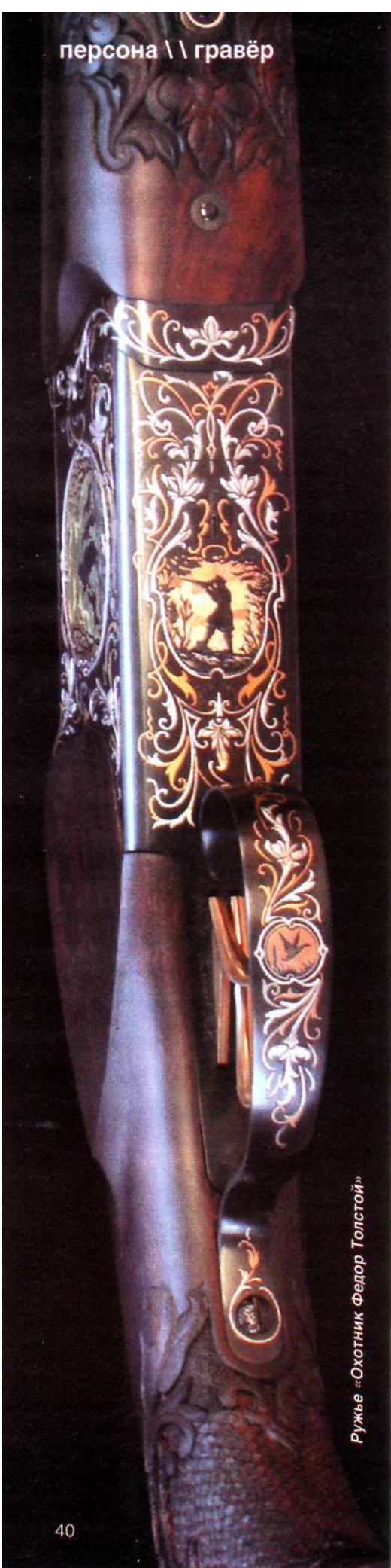
Ружье «Охотник Федор Толстой»