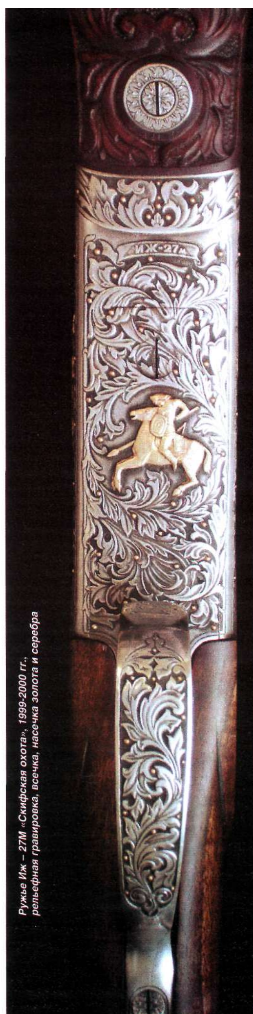
Ружьё Иж – 27М «Скифская охота», 1999-2000 гг., рельефная гравировка, всечка, насечка золота и серебра