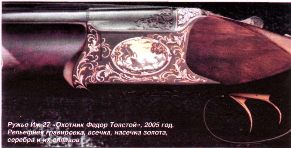
Ружье Иж-27 «Охотник Федор Толстой», 2005 год. Рельефная гравировка, вставка, насечка золота, серебра и их сплавов

и всадника – скифа, выполненных техникой насечки золота. Обобщенность пластики орнамента с пластичной фигур животных создаёт цельность композиции.