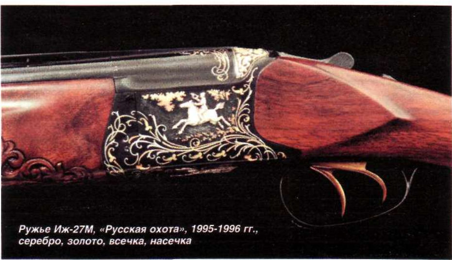
Ружье Иж-27М, «Русская охота», 1995-1996 гг., серебро, золото, всечка, насечка

изобразить. В сюжетных композициях ружья «Диана-охотница» соединились охота и тема возрождения жизни. Кабан – символ охоты, сопротивление, борьба. Игра оленей – образ продолжения жизни. В оформлении ружья мастер соединил технологические приёмы гравировки, характерные для ижевской гравёрной школы – всечку и насечку драгоценных металлов и их сплавов по технологии «ласточкин хвост» с навыками великолепного скульптора и медальера. Личинку ружья венчает изображение богини Дианы, выполненной в технике насечки серебра, с последующей рельефной проработкой. А на боковых плоскостях затворной коробки ружья, по насечённому серебру выполнены барельефные изображения сюжетов и окаймляющего