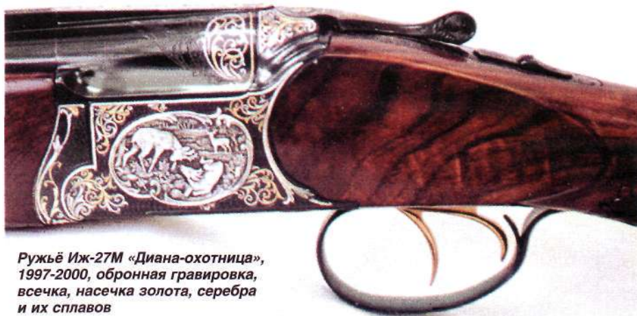
Ружьё Иж-27М «Диана-охотница», 1997-2000, обронная гравировка, всечка, насечка золота, серебра и их сплавов