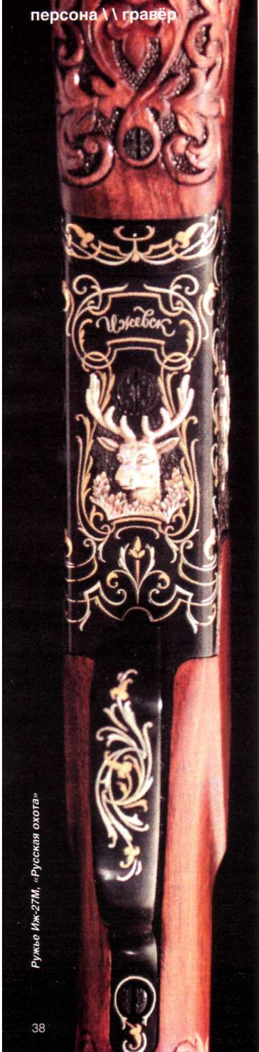
Ружье Иж-27М, «Русская охота»